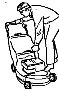
Attention à la position de vos pieds !