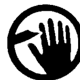
Risque de coupures.