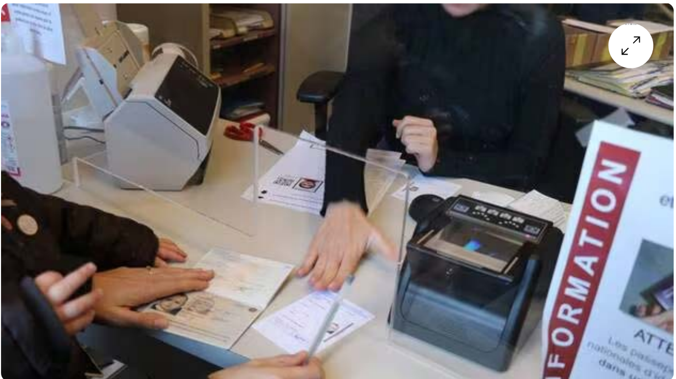
La mairie de Châteaugiron consacre environ vingt rendez-vous par jour aux pièces d'identité.