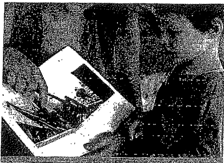
Il s'agit de transmettre un peu de notre histoire.

• Votre rôle d'animateur, d'éducateur à part entière, est ici autre : il s'agit de