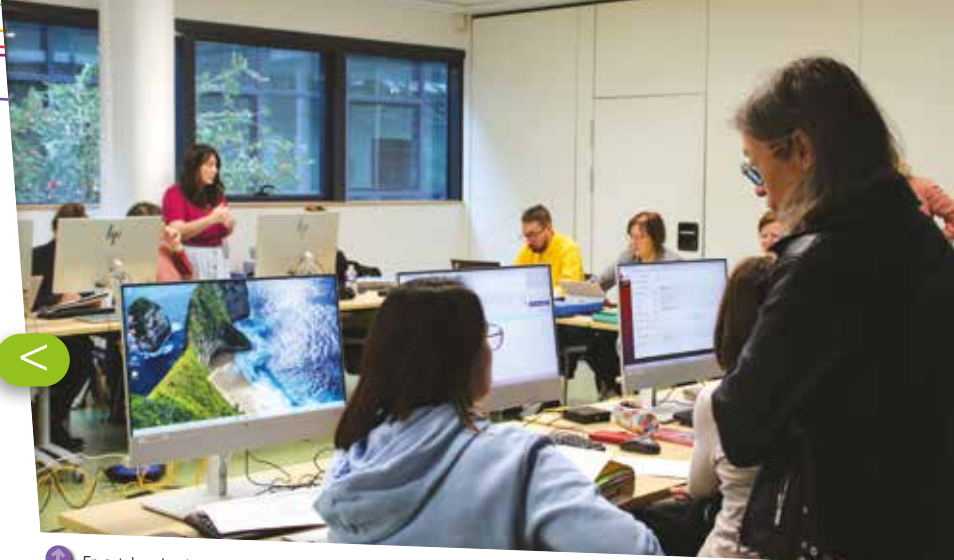
↑ En octobre dernier, le service Conseil statutaire a reçu près de 50 responsables des ressources humaines