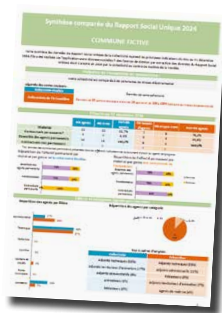
Exemple d'une synthèse comparée