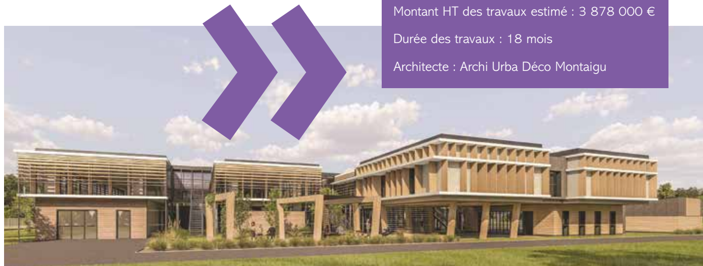
Perspective extérieure à l'étape projet ©Archi Urba Déco Montaigu